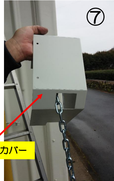
チェーンホイールカバー