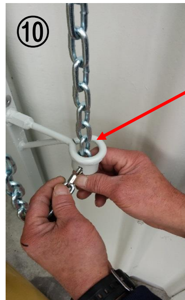
チェーン止め金具